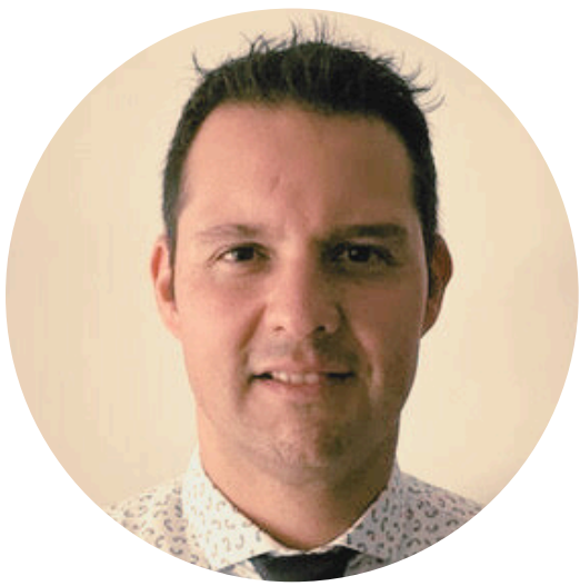
PSICÓLOGO CÉSAR CASTILLO NEYRA CHILE